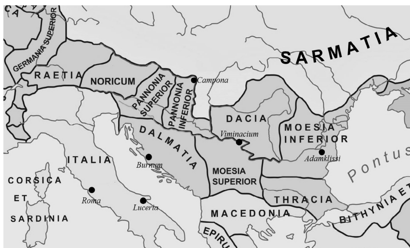
Fig. 2. Distribución geográfica de los Caesaraugustani documentados fuera de la Península Ibérica. (elaboración propia).

toria en honor al dios Esculapio que este Caesaraugustanus realizó junto con otro personaje llamado Q. Rosinius Severus , originario de la ciudad itálica de Mutina . Este voto fue consagrado con posterioridad a la obtención de la honesta missio , lo que permite suponer que T. Popilius Brocchus habría cumplido al menos los dieciséis años de servicio estipulados por Augusto para los miembros del pretorio. 110 Por tanto, es posible que nos encontremos ante un veteranus de las cohortes pretorianas que tras su retirada realizó esta dedicación como agradecimiento por haber sido licenciado con salud.