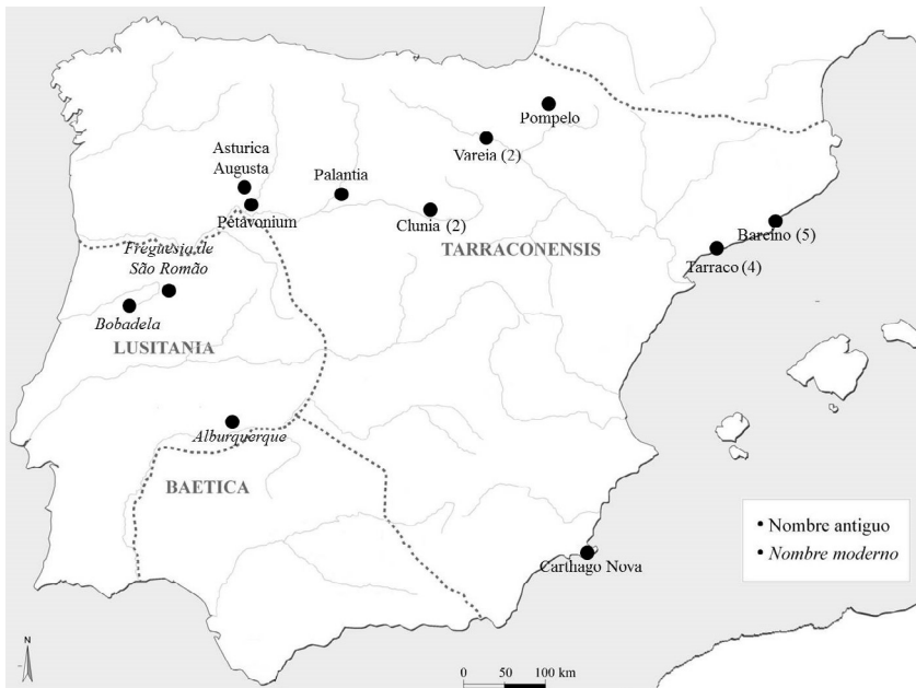
Fig. 1. Distribución geográfica de los Caesaraugustani documentados en la Península Ibérica. Entre paréntesis se indica el número de individuos encontrados en cada ciudad (elaboración propia).

Los habitantes de Caesar Augusta también se proyectaron con frecuencia lejos de su ciudad de origen. Esta movilidad tuvo lugar tanto dentro de la propia Península Ibérica, donde hemos constatado la presencia de diversos Caesaraugustani en otras ciudades de la Hispania Citerior y en varios puntos de Lusitania , como fuera de ella, ya que son también varios los cives de Caesar Augusta documentados en otras provincias del Imperio (fig. 1).