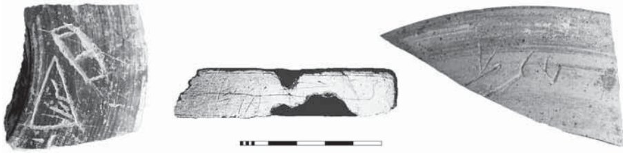
Fig. 4: Izda. y centro, grafito palaeohispánico e inscripción sobre molde de joyería del Castillo de Doña Blanca; dcha., grafito de la Cueva de Gorham.