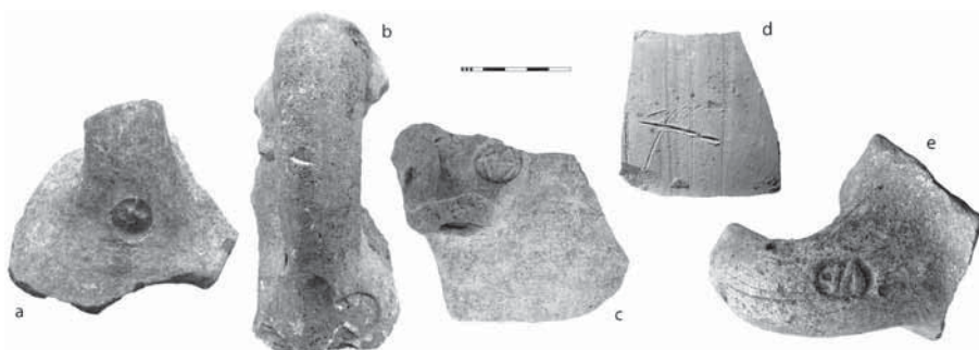
Fig. 3: a. estampilla del solar de los “Cuarteles de Varela”; b-c. estampillas del solar de la “Ciudad de la Justicia” (fotos de A. M a Niveau de Villedary); d. grafito de Torre Alta; e. estampilla de Camposoto (fotos de A. M. Sáez).

Otras actuaciones se han dado extramuros de la ciudad vieja. De allí proceden algunos epígrafes tardíos. Dos estampillas sobre ánforas centro-mediterráneas de finales del s. III a. n. e. se han publicado en el periodo que nos ocupa, aunque se hallaron en excavaciones anteriores —del 1999 en el solar de los “Cuarteles de Varela” (fig. 3a) y del 2005-2006 en el de la nueva “Ciudad de la Justicia” (fig. 3b), de donde procede una tercera impronta publicada poco antes (fig. 3c). 26 Se trata siempre de zonas de la necrópolis púnica y romana, en algún caso con interesantes pruebas de división y uso diferencial del espacio. 27 Los epígrafes remiten en cualquier caso a la zona tunecina, donde los individuos cuyo nombre abrevian interpretaron su papel en el proceso productivo o comercial relacionado —directa o indirectamente— con la fabricación de las ánforas. 28 Otras intervenciones en diferentes áreas del ensanche moderno, cuyos materiales están aún en curso de estudio, han proporcionado grafitos y estampillas epigráficas que publicaremos en el futuro junto a los responsables de los trabajos.