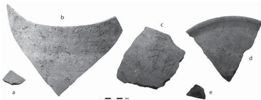
Fig. 2: a. Grafito del solar de “la Calle Ancha”; b-e. grafitos del “Teatro Cómico” (fotos de J. Á. Zamora).

Durante el pasado 2012, en excavaciones de emergencia aún en curso de estudio, apareció en otra zona de la ciudad vieja, en niveles tardo-arcaicos, un nuevo grafito fenicio, incompleto pero bien legible, que publicaremos en breve junto a los responsables del hallazgo.