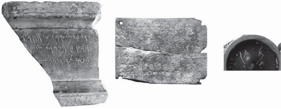
Fig. 6: Inscripciones de Ibiza (izda. y centro, de Ramon et al. 2010, figs. 4 y 6; derecha, de Ramon y Hemanns 2012, fig. 2B; no están a la misma escala)

Por último, poco antes de dar este texto a prensas ha visto la luz la publicación de un grafito mercantil púnico, inciso (junto a uno griego) sobre un fragmento de plato de pescado de cerámica ática (fig. 6 dcha.) hallado en el puerto de Ibiza (Ramon y Hemanns 2012).